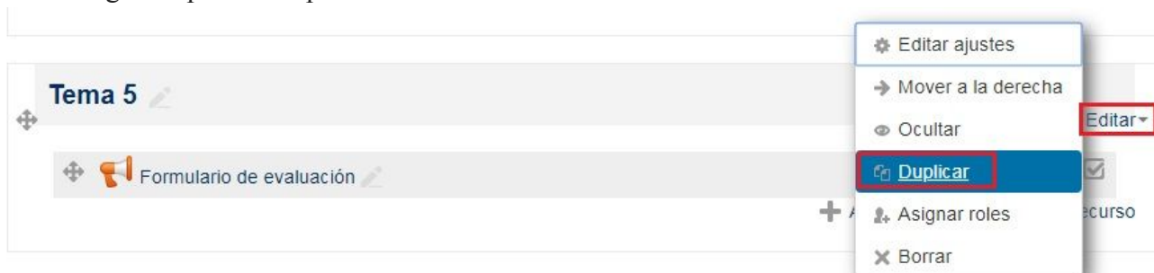
Figura 9: Duplicar una encuesta