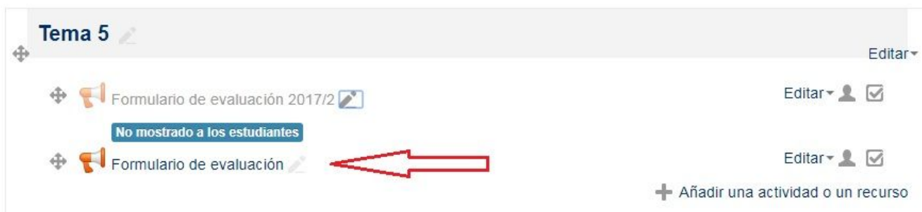
Figura 10: Una vez duplicada la encuesta, se debe dejar disponible solo la que corresponde a la nueva edición del curso.